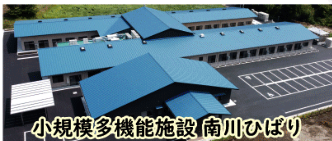
小規模多機能施設 南川ひばり