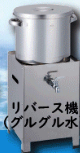
リバース機 (グルグル水)