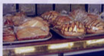
評判のパンは遠方から買ってくる人もいます。