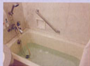
気泡が出るお湯になるのでお肌もしっとり。