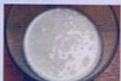
量子水で育てた牛の牛乳は乳酸菌が多いため、長期冷蔵保存しても腐らない。

●腸内の酵素の働きを健やかに保ちながら、乳酸菌を増やす働きもあります。乳酸菌は善玉菌の代表と言われ、善玉菌が増えることによって体内環境が整い、健康維持に役立ちます。便の臭いの劇的な変化を感じられるはず。