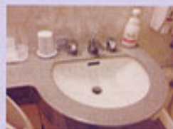
洗面台やトイレなどはいつも清潔。