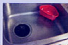
キッチン回りの水アカもなくなり、きれい。

解凍した際の「魚の細胞膜」を顕微鏡で撮影。水道水で解凍した魚は細胞膜が壊れ、隙間も目立つが、量子水では細胞膜が壊れず、赤身の色も鮮やか。