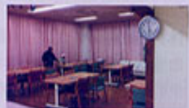
衛生面が行き届き、清潔感にあふれる室内。

管にこの装置を接続し、エネルギーが変化した水(量子水)を、豚たちに飲ませていたそうです。