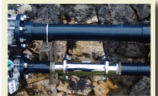
客室・プール・他

■導入のきっかけは・・・ 従業員にはνG7-Lを設置してます。 寮に設置し、従業員が何かしら感じられたら 施設への導入を検討してましたが 「お米がおいしい」「シャワーが気持ち良い」と 従業員の声がたくさん上がったので、 「これはホンモノだ」と導入へのきっかけと なりました。