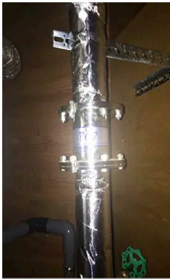
νG7(ニュージーセブン)50A・2連